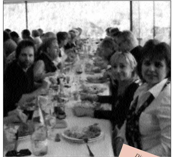
Dinar de celebració del Dia Internacional de la Dona Treballadora

El nostre objectiu és que les dones de Navàs trobin un lloc on ser escoltades, assessorades i compreses. No dubteu a demanar informació a Serveis Socials.