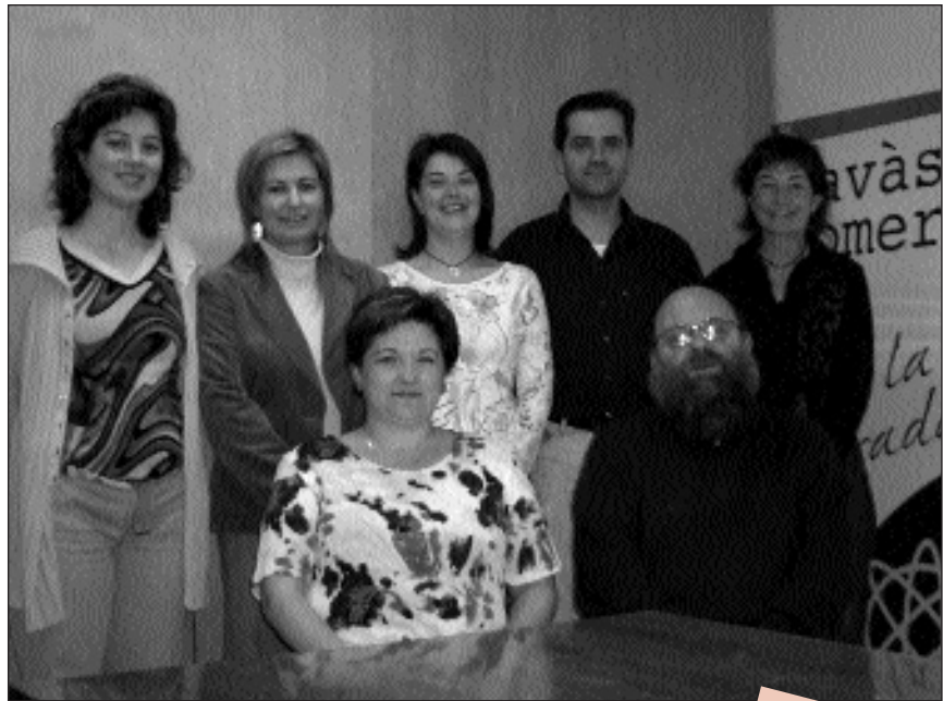
Imatge de grup dels membres de la nova junta de la UBIS

usuàries del comerç local, donem les gràcies a la junta entrant i a la sortint per l'esforç i el treball que dediquen al progrés de Navàs des del sector de serveis.