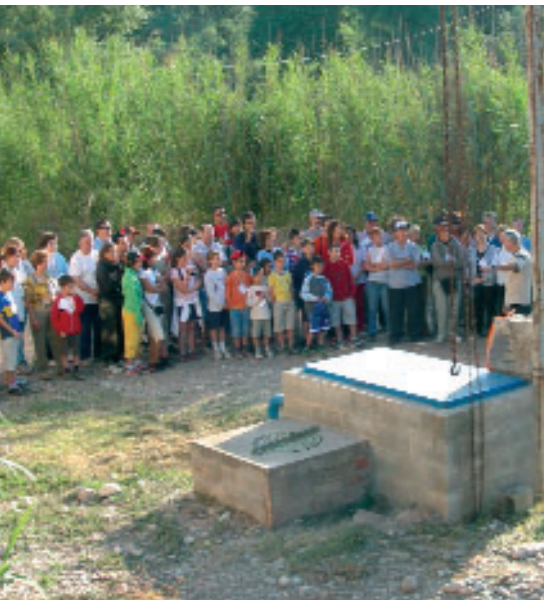
Un centenar de persones van participar en aquesta activitat per conèixer el sistema d'abastament d'aigua de Navàs

El diumenge 4 de juny Navàs va celebrar el Dia Mundial del Medi Ambient amb una caminada seguint el traçat que segueix l'aigua que s'utilitza a la població. La Ruta de l'Aigua va servir per donar a conèixer el sistema d'abastament d'aigua potable i les seves instal·lacions i, al mateix temps, per sensibilitzar sobre la conveniència de fer un ús racional de l'aigua. Sortint de l'Ajuntament, el grup es va dirigir cap al riu Llobregat per veure la localització dels pous de captació. Seguidament van visitar-se la planta de filtrat i les bombes d'impulsió, per després anar cap als dipòsits d'emmagatzematge de l'aigua potable, des d'on es fa la distribució cap a tot el poble. La caminada es va acabar a la depuradora que tracta les aigües residuals per tornar-les al riu Llobregat en perfectes condicions.