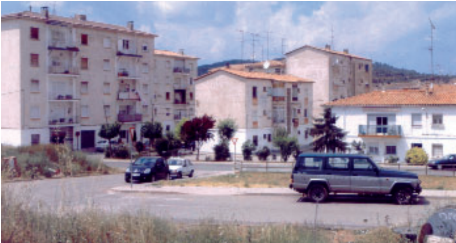
Es va fer una reunió per explicar quins passos cal seguir per accedir a les ajudes

A petició de l'Ajuntament de Navàs, representants del departament de Medi Ambient i Habitatge van venir per donar a conèixer les actuacions que cal fer a nivell administratiu per tal de poder accedir a les subvencions del 2006 per a la millora dels habitatges del barri de Cal Miquel. A la reunió també es van explicar tots els passos que cal que els propietaris segueixin per poder accedir als préstecs que van signar el departament i les caixes d'estalvi catalanes. La trobada va aprofitar-se per fer el lliurament dels projectes per part de l'arquitecte redactor. L'Ajuntament subvencionarà l'import de les llicències d'obres.