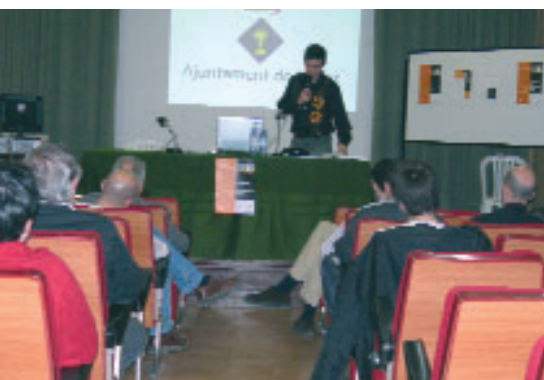
Un moment de la jornada

La sala d'actes de l'Escola Diocesana de Navàs va acollir el passat 25 de març la segona jornada de programari lliure. Un important nombre d'experts en el tema van compartir coneixements i experiències entorn a la utilització i desenvolupament de tecnologies de la informació d'ús lliure i obert. La jornada era organitzada per la regidoria de Promoció Econòmica de l'Ajuntament, l'Escola Diocesana de Navàs i el Telecolòni@ del Parc Fluvial de la Xarxa de Telecentres de