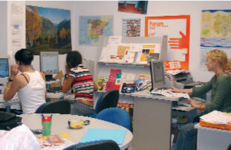
Vista general de les oficines