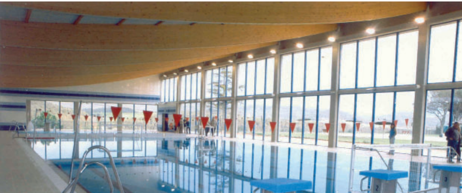
Una vista interior del nou complex esportiu

Després de molts mesos de projectes i obres, l'esperada piscina coberta arriba al seu procés final i ja està a punt per ser estrenada. L'Ajuntament de Navàs té la intenció que aquest equipament no sigui només una piscina, sinó que es converteixi en un complex esportiu municipal que sigui un eix de salut, lleure i esport, i en el qual tinguin cabuda des de nadons fins a persones grans.