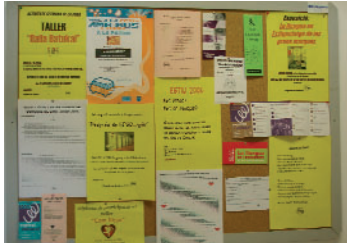
El cartell que anuncia les activitats del Raig

“Com lligar”, “Balla Batuka”, “Com maquillar-se” o “Mites de l'amor” són els noms d'alguns dels tallers que el Raig ha organitzat al llarg d'aquest any. Aquesta entitat gestiona les activitats que s'organitzen des de la regidoria de Joventut i, a més de programar actes puntuals, dona suport a les entitats juvenils, assessora els joves en temes que són del seu interès com ara estudis, viatges o estades i posa a la seva disposició ordinadors amb accés gratuït a internet.