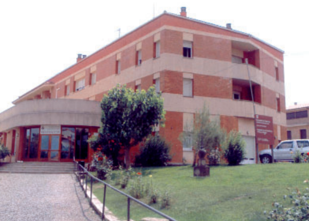
La residència té actualment 75 places i un centre de dia

L'empresa navassenca Construccions Viscola serà l'encarregada de dur a terme l'ampliació de la residència d'avis de Navàs. Aquesta empresa va ser l'única que es va presentar al concurs públic convocat per l'Ajuntament i haurà de començar les obres en un termini de 6 mesos, després d'haver presentat el projecte de seguretat i salut. Les obres tenen un cost de prop de 200.000 euros, dels quals 58.000 són subvencionats pel departament de Benestar i Família de la Generalitat, 9.000 per Caixa Manresa i la resta provenen del fons de la pròpia residència, a partir de donacions dels avis. A aquesta quantitat cal sumar-hi el cost del mobiliari per a equipar els serveis, que és de 16.000 euros.