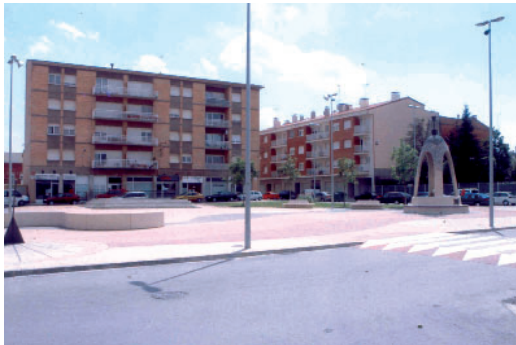
La Plaça Gaudí ha sofert moviments a causa de la complicada configuració del terreny

Des que es va inaugurar el juliol del 2002, la Plaça d'Antoni Gaudí ha sofert moviments ben visibles a causa de la complicada configuració del terreny. És per això que l'Ajuntament va demanar a l'empresa constructora que fes un control de les desviacions del terreny, tasca que s'ha fet durant dos anys. Els resultats dels estudis mostren un moviment d'uns 15 centímetres però afirmen que actualment el terreny està estabilitzat. Tenint en compte aquests