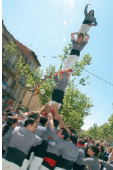
Diferents imatges de la fira: a dalt, actuació castellera i a la dreta, vista general de l'ambient de la fira i actuació del grup Gog i Magog

L'edició de l'any vinent, la 75ena, se celebrarà els dies 21 i 22 d'abril i esperem que sigui una bona ocasió per a convertir-la en un bon referent per a la comarca.