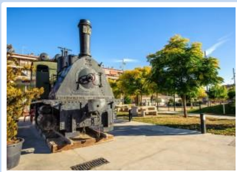
Parc de l'Estació