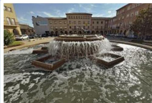
Plaça de l'Ajuntament