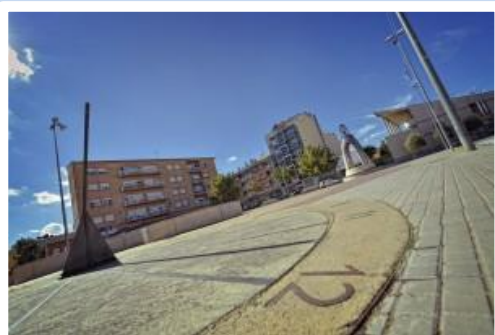
Parc Antoni Gaudí