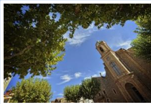
Plaça de l'Església