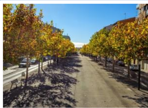
Passeig Ramon Vall