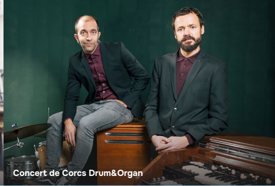
Concert de Corcs Drum&Organ