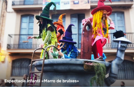
Espectacle infantil «Marro de bruixes»