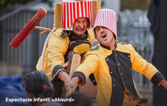
Espectacle infantil «Absurd»